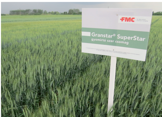
Granstar® SuperStar gyomirtó szerrel kezelt búza (Tokaj, 2019)