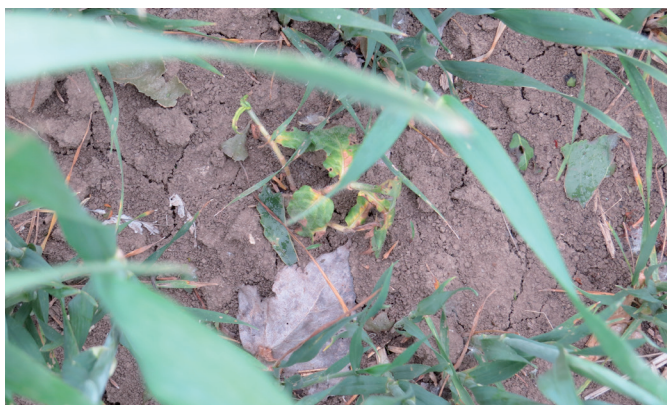
Pointer® Star hatása vidra keserűfű ellen (Tokaj, 2019)