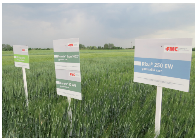
FMC komplex védelemben részesített parcella (Tokaj, 2019)

Az FMC kalászos technológiai csomagok további közös előnye, hogy a csomagalkotó készítmények keverhetősége kipróbált és biztonságos a kultúrnövényre. Azon túl, hogy az egyes termékek ára a szőlő termékekhez képest csomagban jóval kedvezőbb, a Riza® 250 EW gombaölő szer igen jelentős árcsökkentése a komplex csomagok árát is jelentősen csökkenti 2020-ban.