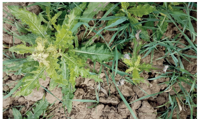
Granstar® Super 50 SX® a megbízható standard