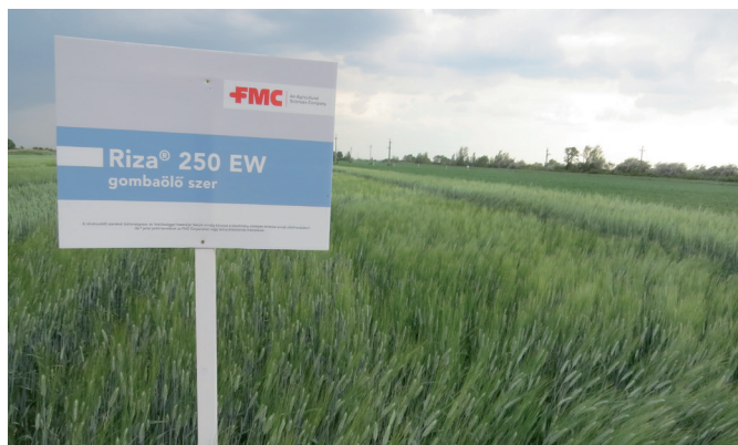
Riza® 250 EW gombaölő szerrel kezelt parcella (Tokaj, 2019)

Az FMC kalászos technológiai csomagok további közös előnye, hogy a csomagalkotó készítmények keverhetősége kipróbált és biztonságos a kultúrnövényre. Azon túl, hogy az egyes termékek ára a szőlő termékekhez képest csomagban jóval kedvezőbb, a Riza® 250 EW gombaölő szer igen jelentős árcsökkentése a komplex csomagok árát is jelentősen csökkenti 2020-ban.